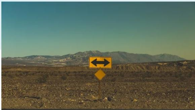
El Ibex y los europeos mantienen echado el freno atentos a Washington y Pekín

Apertura tranquila con suaves compras en la renta variable europea y ventas de bonos de buena parte del Viejo Continente. La guerra comercial marca el tono inicial de esta semana, hoy que llega a Washington la delegación china, encabezada por el vice primer ministro Liu He , que firmará la "primera fase" del acuerdo comercial entre China y Estados Unidos. Este hecho se suma al arranque, mañana, de la presentación de los resultados del cuarto trimestre en Wall Street (con grandes bancos como JP Morgan Chase, Citigroup, y Wells Fargo). A la espera de estas dos citas, el Ibex 35 apenas se mueve de su nivel de cierre previo, en 9.579 puntos.