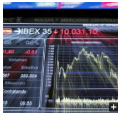
Sin reacción: El Ibex 35 no levanta cabeza tras la mayor caída del año

En la agenda macro hoy se ha conocido que el PIB de la economía española creció un 0,5% en el segundo trimestre de este año, dos décimas inferior a la registrada en el primer trimestre, al tiempo que recortó una décima su tasa interanual, hasta el 2,3%. No obstante, el dato más preocupante para las bolsas ha llegado desde China, donde la industria manufacturera ha registrado en julio su tercer mes consecutivo de contracción , aunque el indicador de referencia, el índice gerente de compras (PMI), avanzó 0,3 puntos hasta los 49,7 puntos.