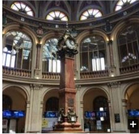
Rebote 'Supremo' del Ibex, que reconquista los 9.000 puntos

Para el día de hoy, explican en Link Securities, "el nivel de sobreventa de muchos valores favorecerá este rebote, aunque no esperamos que, de momento, y dado el "panorama" en Europa y a nivel mundial, éste vaya a ir muy lejos. Entre quienes presentan resultados en Wall Street, atención en la semana a gigantes como Amazon, Alphabet, Microsoft, Ford, McDonalds, Caterpillar o Boeing